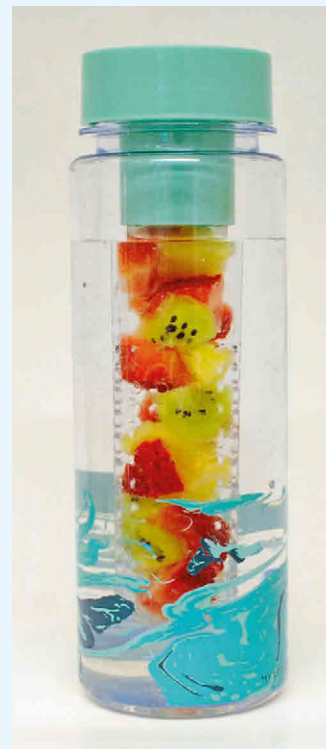
Trinkflasche mit Fruchteinsatz