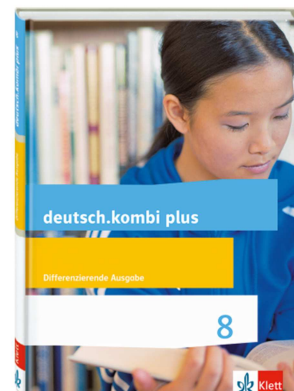
Schülerbuch 8 ISBN: 978-3-12-313474-6