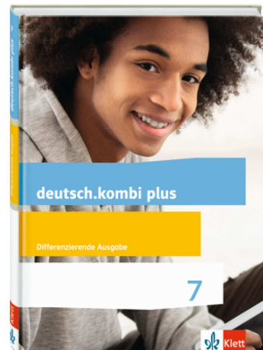
Schülerbuch 7 ISBN: 978-3-12-313473-9