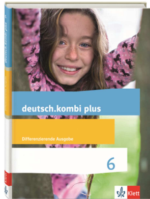
Schülerbuch 6 ISBN: 978-3-12-313472-2