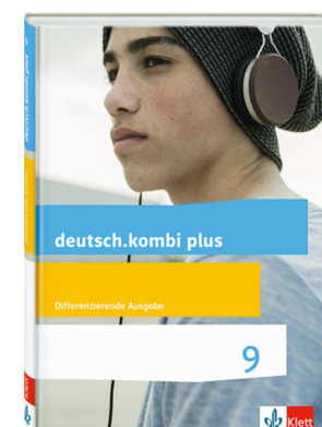
Schülerbuch 9 ISBN: 978-3-12-313475-3