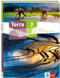
Schülerbuch 2 Klassen 7/8 ISBN: 978-3-12-105302-5

Erdkunde | Differenzierende Ausgabe (Real-, Sekundar- und Gesamtschule)