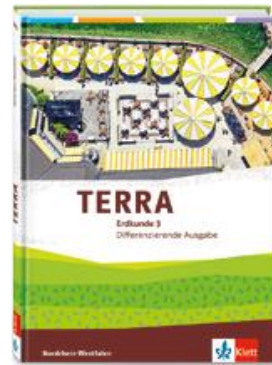
TERRA SB 3 (Klasse 9/10) ISBN: 978-3-12-104914-1